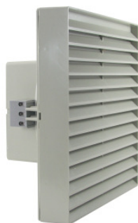
LS 0 K