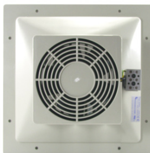
LS 0 (K)